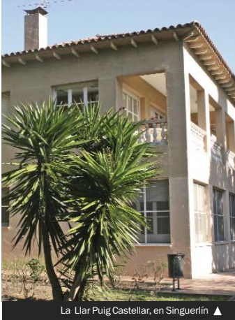
La Llar Puig Castellar, en Singuerlín ▲

► Para mejorar la atención social de la población de Santa Coloma de Gramenet en la actual época de crisis económica, el Ayuntamiento puso en marcha el pasado mes de noviembre el Telèfon d'Atenció a les Famílies. A través del número 93 462 40 77, las personas interesadas pueden concretar una entrevista con los profesionales de los Servicios Sociales, que realizarán la valoración y el diagnóstico de la situación social de la persona afectada antes de ser derivada al comedor social o al programa de apoyo a la alimentación que mejor se ajuste a sus necesidades.