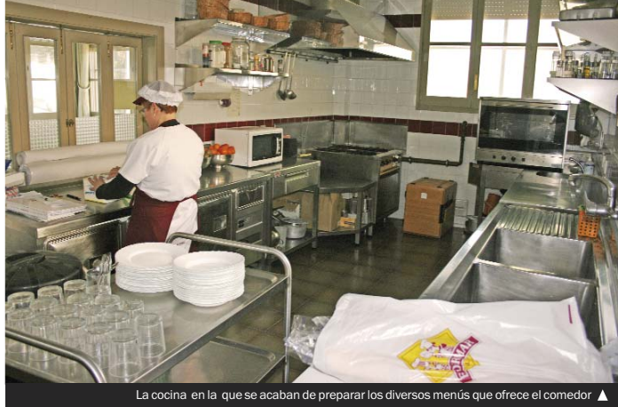
La cocina en la que se acaban de preparar los diversos menús que ofrece el comedor ▲

► L'Auditori Can Roig i Torres ja té enllestida la nova programació musical, que començarà el 22 de febrer i acabarà al juny. Seran 16 concerts en total, majoritàriament de música clàssica i contemporània combinada amb altres estils com el jazz i el pop. Hi haurà les actuacions de músics emergents i d'interpretos professionals consolidats, així com professors, alumnes i exalumnes de l'Escola Municipal de Música. El preu serà assequible en alguns espectacles o totalment gratuït en d'altres.