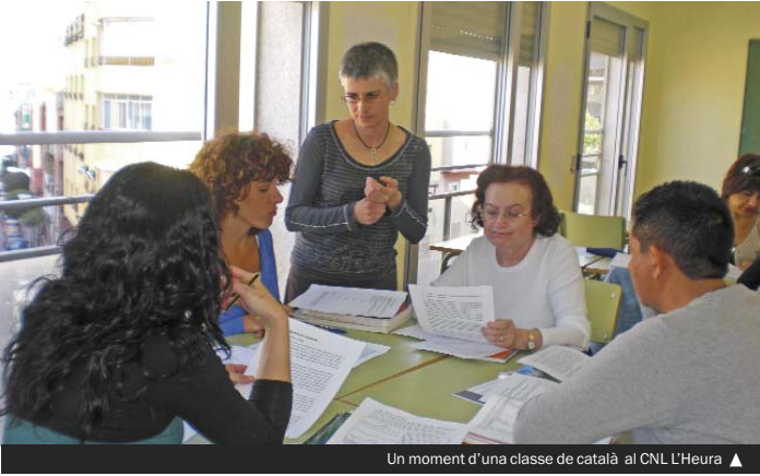
Un moment d'una classe de català al CNL L'Heura ▲