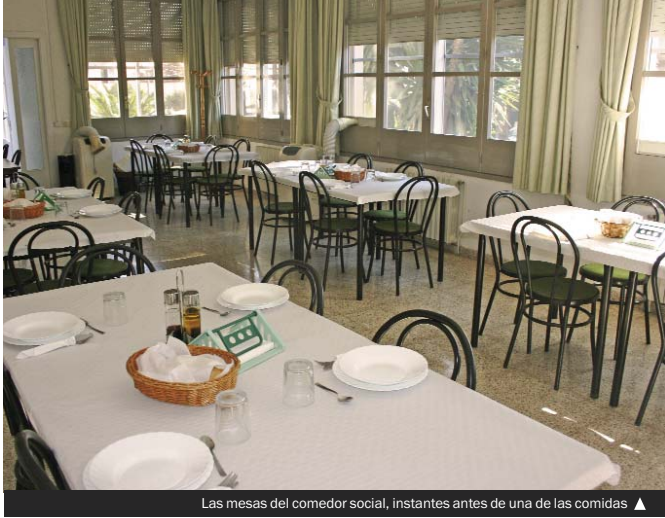
Las mesas del comedor social, instantes antes de una de las comidas ▲

▶ Este año 2013 se cumplen veinte desde la puesta en marcha del comedor social, un servicio municipal destinado a la población de Santa Coloma de Gramenet para atender las necesidades de alimentación de los vecinos y las vecinas más vulnerables por estar en una situación de precariedad.