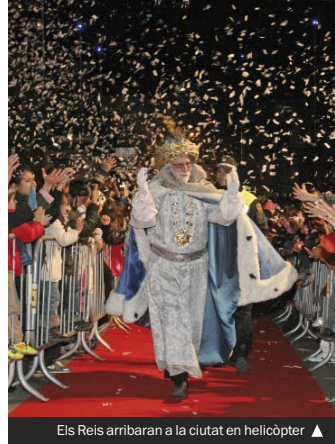
Els Reis arribaran a la ciutat en helicòpter ▲

Hi haurà, a més, diverses competicions esportives amb objectius solidaris (en destaca la cursa de San Silvestre del dia 30), entre altres moltes propostes.