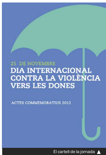
El cartell de la jornada ▲

PROTOCOL CONTRA LA VIOLÈNCIA Des de l'any 2000, Santa Coloma té un protocol d'actuació conjunta entre diferents institucions i serveis implicats en la lluita contra la violència vers les dones. Amb el pas del temps, amb els canvis en la conceptualització, la legislació, els