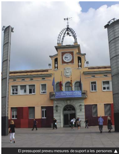
El pressupost preveu mesures de suport a les persones ▶

Una de les novetats del proper exercici serà la posada en marxa d'un pla d'ocupació local dotat amb 800.000 eu-