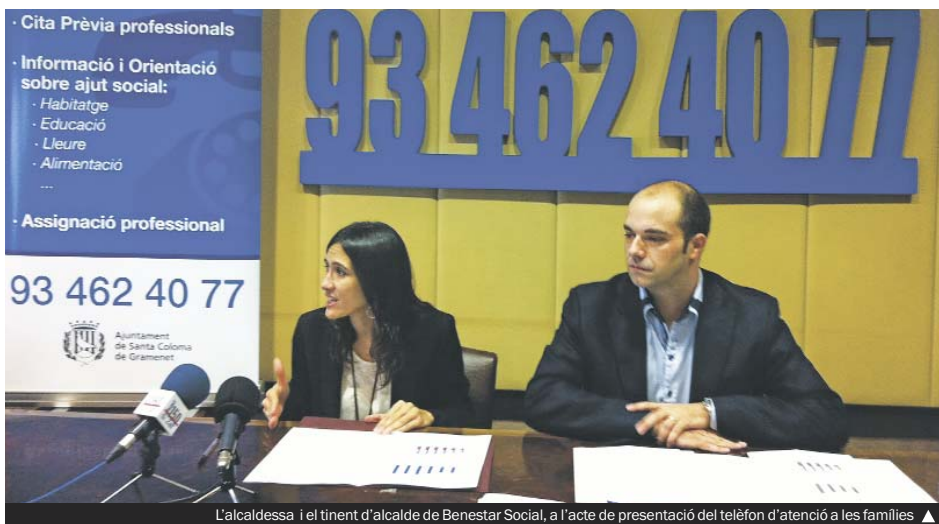
L'alcaldesa i el tinent d'alcalde de Benestar Social, a l'acte de presentació del telèfon d'atenció a les famílies ▶