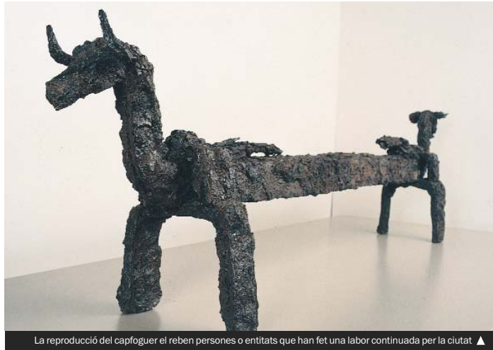
La reproducció del capfoguer el reben persones o entitats que han fet una labor continuada per la ciutat ▲

Els Premis podran ser atorgats a persones físiques o jurídiques arrelades a la ciutat que, com a conseqüència de les seves actuacions concretes i desinteressades en benefici de Santa Coloma, siguin creditors del reconeixement. Excepcionalment, però, els Premis poden recaure sobre una persona o una entitat no local. Un jurat cívic, presidit