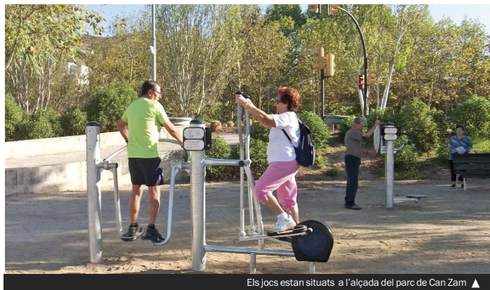
Els jocs estan situats a l'alçada del parc de Can Zam ▲

Aquesta instal·lació ha estat coordinada per l'Ajuntament i l'Àrea Metropolitana de Barcelona i és una de les actuacions contemplades al Pla d'acció municipal (PAM) de l'actual mandat.