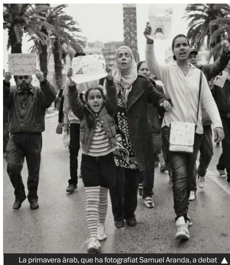
La primavera àrab, que ha fotografiat Samuel Aranda, a debat ▲

La Festa de la Cooperació del dia 21 serà l'acte central de les Jornades, que prestaran també una atenció especial també a dues dates: la del 17 d'octubre, Dia Internacional contra la Pobresa, i la del 24 d'octubre, Dia de les Nacions Unides.