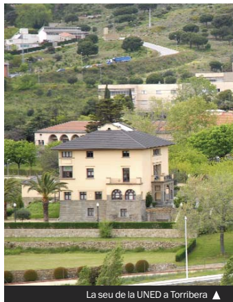
La seu de la UNED a Torribera ▲

El termini d'inscripció es tancarà el proper 4 de novembre. Els preus són molt econòmics. Les persones amb una discapacitat reconeguda tindran la matrícula gratuïta; les famílies nombroses de categoria general gaudiran d'una re-