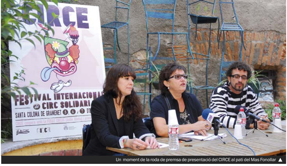
Un moment de la roda de premsa de presentació del CIRCE al pati del Mas Fonollar

El CIRCE és un projecte de cooperació cultural, que compta amb el suport de l'Ajuntament i la Diputació. La recaptació que s'aconsegueixi, a través de les aportacions voluntàries del públic, es destinarà a dos projectes: un de sensibilització —la posada en marxa del Circescola perquè els joves i els infants colomencs en risc social hi aprenguin les arts circenses— i un altre de cooperació internacional mitjançant la col·laboració amb l'associació Fekat Circus d'Addis Abeba (Etiòpia). Entre altres objectius, el CIRCE es planteja difondre aquestes arts i estimular les vocacions; enriquir el paisatge cultural de la ciutat; facilitar l'accés de tothom als espectacles a la via pública; afavorir el diàleg, la convivència i el respecte entre persones de diverses cultures, i sensibilitzar la població sobre situacions de desavantatge o de risc d'exclusió. ▶▶ Pág.2