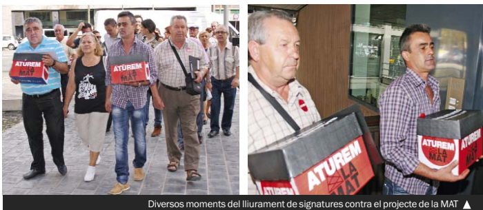
Diversos moments del lliurament de signatures contra el projecte de la MAT ▲