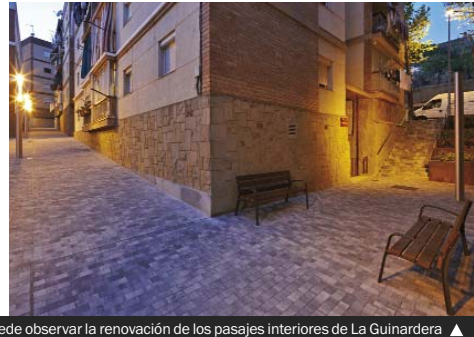
En estas imágenes —diurna y nocturna— se puede observar la renovación de los pasajes interiores de La Guinardera

las personas responsables de los Servicios Territoriales municipales y con el arquitecto redactor del proyecto, y se recogieron las propuestas ciudadanas que han formado parte de la intervención.