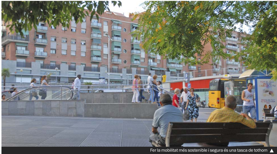
Fer la mobilitat més sostenible i segura és una tasca de tothom ▲