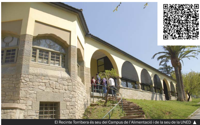
El Recinte Torribera és seu del Campus de l'Alimentació i de la seu de la UNED ▲

Una de les principals novetats és la posada en marxa de l'oferta de màsters i postgraus; el primer d'ells —Seguretat Alimentària— està organitzat per la UB, la Universitat Autònoma de Barcelona i l'Agència Catalana de Seguretat Alimentària. Aquesta oferta inicial es complementarà amb el màster de Desenvolupament e Innovació d'Aliments, Nutrició i Metabolisme i el d'Història i Cultura de l'Alimentació, adscrit a la Facultat de Geografia i Història. Altres novetats destacades són la posada en marxa de l'edifici docent i d'atenció a l'estudiant (pavelló Verdager); el proper trasllat d'investigació a l'edifici de recerca (Gaudí), i la destinació de l'edifici de laboratoris docents (Marina) als tercers cursos dels dos graus que s'hi imparteixen. Més informació a www.gramenet.cat i a partir del QR d'aquesta pàgina.