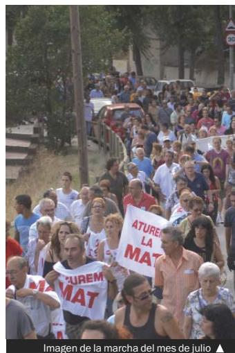
Imagen de la marcha del mes de julio ▲

Al día siguiente, 21 de septiembre, finalizará el primer período de recogida de firmas en demanda de la paralización de la MAT. La Comissió hace un llamamiento a toda la ciudadanía para que se implique y muestre su