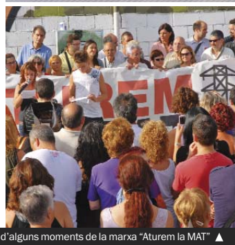
Imatges d'alguns moments de la marxa "Aturem la MAT" ▲