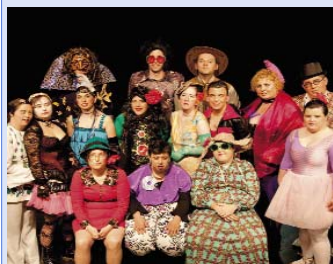
Lloc: Auditori Can Roig i Torres (carrer de Rafael Casanova, 5).

La companyia Alquimistes Teatre ( www.alquimistes.com ), formada per joves amb discapacitat psíquica, representaran el seu nou projecte, Una lámpara encendida , el 16 de juny (20.30). Es tracta d'un documental, dirigit per Claudio Villa-Lobos, amb la col·laboració de Els 4 Vents. És un recorregut pel procés creatiu dels Alquimistes en què podem veure la passió pel teatre d'aquest col·lectiu i la millora de les seves capacitats i habilitats.