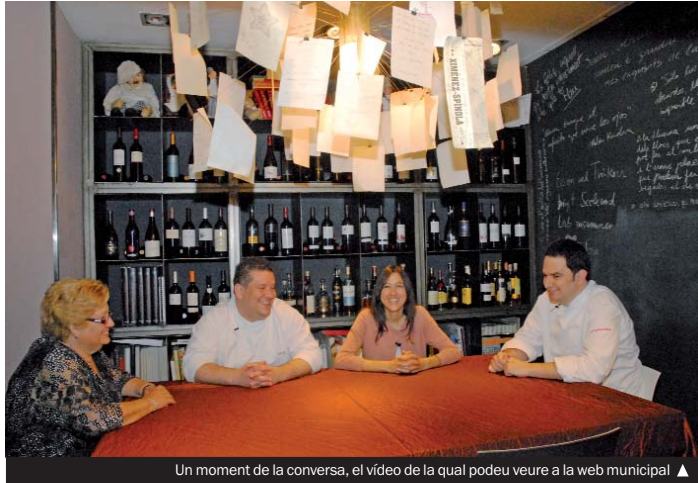
Un moment de la conversa, el vídeo de la qual podeu veure a la web municipal ▶