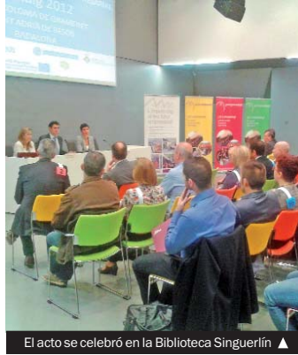
El acto se celebró en la Biblioteca Singuerlín ▲