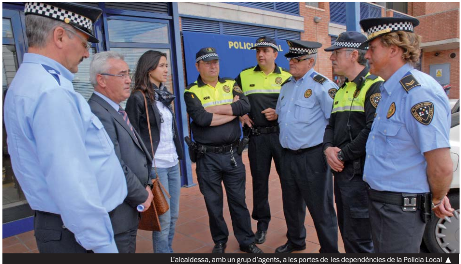
L'alcaldesa, amb un grup d'agents, a les portes de les dependències de la Policia Local ▲