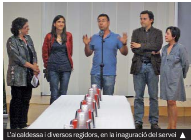
L'alcaldesa i diversos regidors, en la inauguració del servei ▲

► Amb la inauguració del bar del Centre Cívic Riu —el 17 de maig—, que va registrar una gran participació, es dona un pas més en la normalització d'aquests espais. Els centres del Llatí, el Riu Nord i la Riera Alta, on també s'ha inaugurat el servei de bar, compten des d'aquest mes amb un horari d'apertura més ampli (matins). El dia 30 es reobrirà el bar del Centre Cívic de Can Mariner que tanca aquest primer cicle d'inauguracions.