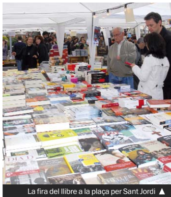
La fira del llibre a la plaça per Sant Jordi ▲

A les set de la tarda, la cobla Premià protagonitzarà una audició de sardanes a la plaça de la Vila organitzada pel Patronat pro Aplec. A la mateixa hora, també a la plaça, la secció local d'Omnium Cultural farà una lectura de poemes d'arreu del món en la llengua originària i traduïts al català amb el lema "A tota veu".