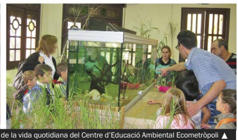
Diversos moments de la vida quotidiana del Centre d'Educació Ambiental Ecometròpoli ▶