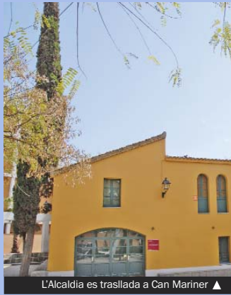
L'Alcaldia es trasllada a Can Mariner ▲