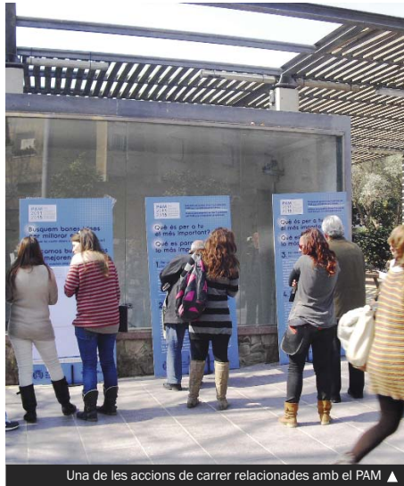
Una de les accions de carrer relacionades amb el PAM ▲

El termini de recepció finalitzarà el 30 d'abril. Als equipaments esmentats s'han instal·lat unes bústies especials per recollir les enquestes i, allora, s'hi ofereix el