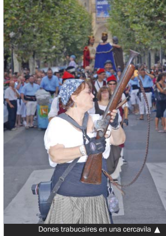
Dones trabucaires en una cercavila ▲

L'objectiu és fer visible el paper de les dones en el món trabucaire, que ha estat restringit als homes fins fa poc temps. Hi participen una cinquantena de dones trabucaires de tot Catalunya, entre les quals destaquen les de la Colla de Trabucaires de la nostra ciutat. Hi haurà una cercavila (13.00 hores), que començarà a la Torre Balldovina i finalitzarà a la plaça de la Vila. Després tindrà lloc una recepció oficial per part de l'alcaldesa, Núria Parlon.