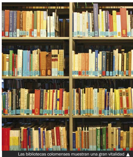
Las bibliotecas colomenses muestran una gran vitalidad ▲

El cierre provisional de la Biblioteca Central durante tres meses para mejorar su climatización —el pasado verano—, da la única cifra a la baja en todos los registros de las bibliotecas colomenses del año 2011. Y aún así, las visitas realizadas en ese periodo a la Biblioteca Central fueron 194.215, unas sesenta mil menos que en el 2010. Por el contrario, las cifras crecieron en Can Peixauet, que recibió 128.086 visitas (125.466 en el 2010) y en Singuerlín, 99.984 (65.784 en el 2010).