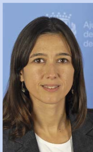
Núria Parlon Gil Alcaldeessa de Santa Coloma de Gramenet