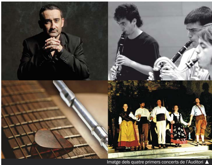
Imatge dels quatre primers concerts de l'Auditori ▲