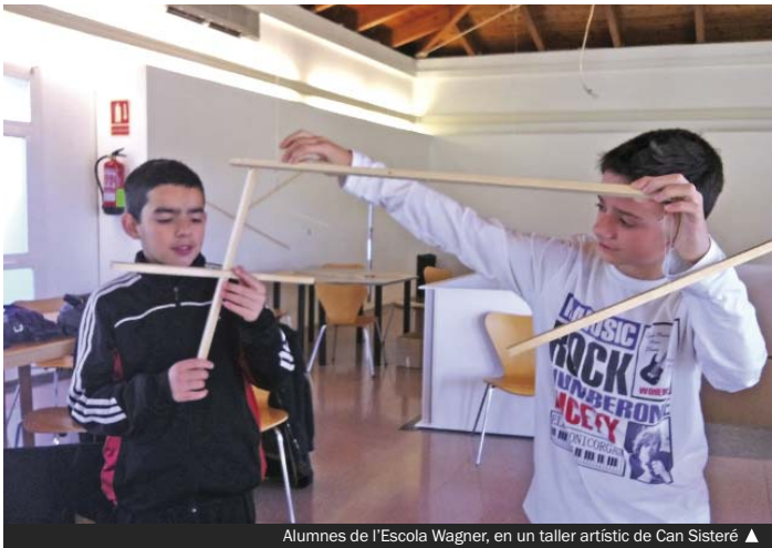
Alumnes de l'Escola Wagner, en un taller artístic de Can Sisteré ▲

Aquesta mesura s'ha portat a l'aprovació del Ple quan al Registre Municipal no hi ha cap sol·licitud de llicència per obrir o remodelar un centre d'aquestes característiques a la ciutat.