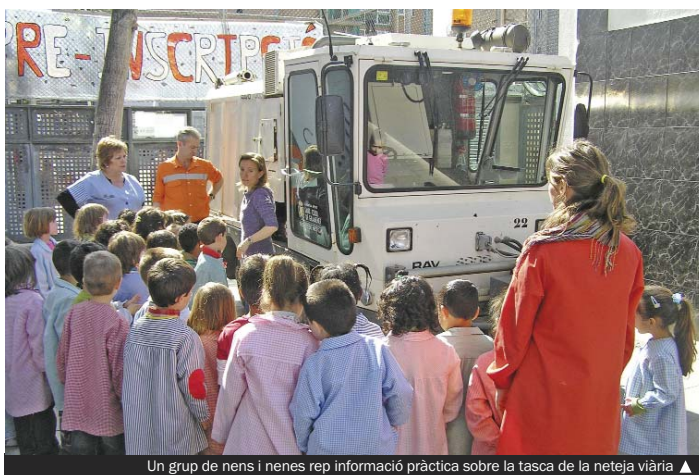
Un grup de nens i nenes rep informació pràctica sobre la tasca de la neteja viària ▲

L'alumnat del cicle inicial de primària ja està treballant, amb material de suport creat d'una manera expressa, les diferents actituds cíviques i incíviques que es donen a la ciutat i les adients per cons-