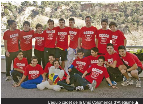
L'equip cadet de la Unió Colomenca d'Atletisme ▲

L'equip colomenc ja havia obtingut un premi al seu treball en classificar-se, per primera vegada en la història de l'atletisme a Santa Coloma, per a aquest Campionat. No obstant això, el dia de la prova