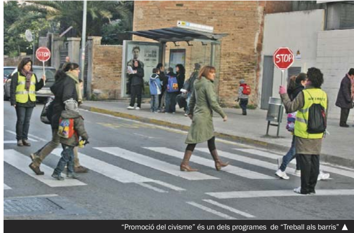
"Promoció del civisme" és un dels programes de "Treball als barris" ▲

► L'Ajuntament, a través de l'empresa municipal Grameimpuls, ha posat en marxa una nova convocatòria de "Treball als barris". Es tracta d'un conjunt de programes de formació i ocupació laboral destinat a la millora social, econòmica i urbana dels barris de la serra d'en Mena (el Fondo, Santa Rosa, el Raval i els Safarejots) i dels barris centrals (el Centre, Cementiri Vell, el Llatí, la Riera Alta, el Riu Nord, el Riu Sud i