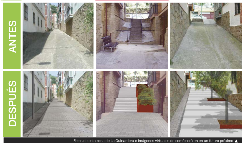
Fotos de esta zona de La Guinardera e imágenes virtuales de cómo será en un futuro próximo ▶