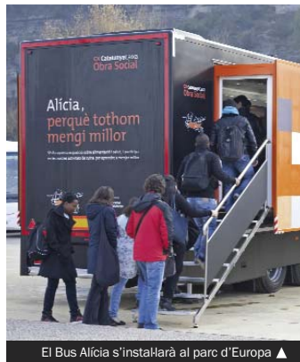
El Bus Àlicia s'instal·larà al parc d'Europa ▲

El Bus estarà obert al públic de 10.30 a 14.00 i de 15.00 a 19.30. Hi haurà visites guiades a l'exposició per a una comprensió més profunda dels continguts. Les visites són lliures i els tallers tenen