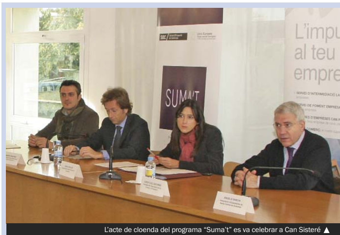
L'acte de cloenda del programa "Suma't" es va celebrar a Can Sisteré ▲