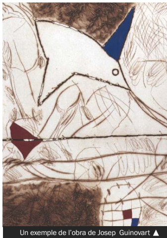
Un exemple de l'obra de Josep Guinovart ▲