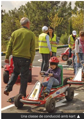
Una classe de conducció amb kart ▲

Per primer cop es farà el parc infantil de bicicletes al Recinte Torribera, una activitat que s'adreça a l'alumnat del primer cicle de primària i que durant set anys es va impartir al pati de l'escola Fray Luis de León. Hi participaran 1.300 nens i nenes procedents de 52 aules. D'altra banda, aquest és el quart any que es porten a terme les "Accions tutorialis en matèria d'e-