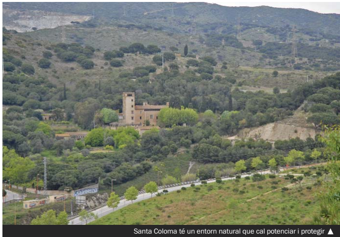
Santa Coloma té un entorn natural que cal potenciar i protegir ▲

Actualment, Espanya té una superfície arbrada de 14,7 milions d'hectàrees