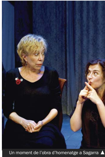
Un moment de l'obra d'homenatge a Sagarra ▲

A la nit, (21.00 hores) al Teatre Sagarra s'ofereix l'espectacle "Sagarra dit per Rosa Ma. Sardà", un recorregut per l'obra de Josep M. de Sagarra de la mà de la reconeguda actriu Rosa Ma. Sardà. Al llarg d'una hora i escaig un recull de versos, poemes, articles periodístics i teatre, seran llegits, dits i interpretats de manera magistral per la famosa actriu. Gràcies a la col·laboració de Mercè Pons i Rosa Vila s'ha rescatat una de les millors escenes