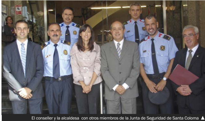
El conseller y la alcaldesa con otros miembros de la Junta de Seguridad de Santa Coloma ▲

Según Felip Puig, Santa Coloma necesita reforzar más su percepción de seguridad -visualizar más efectivos policiales