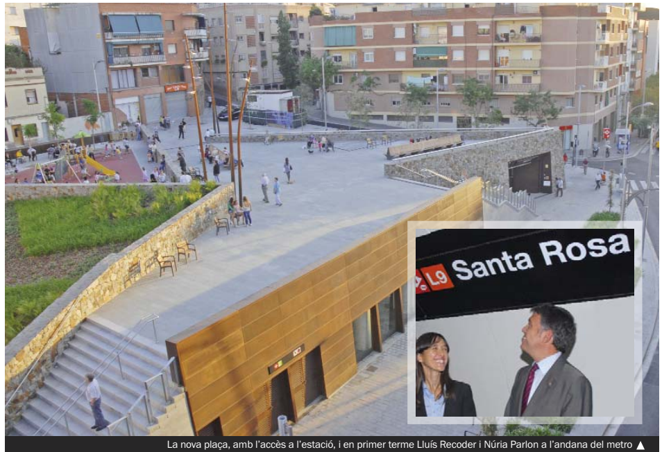
La nova plaça, amb l'accés a l'estació, i en primer terme Lluís Recoder i Núria Parlon a l'andana del metro ▲

Amb les sis estacions de la L9 en marxa a Santa Coloma, des d'aquesta ciutat es pot accedir al centre de Barcelona en qüestió de minuts, a través de l'intercan-