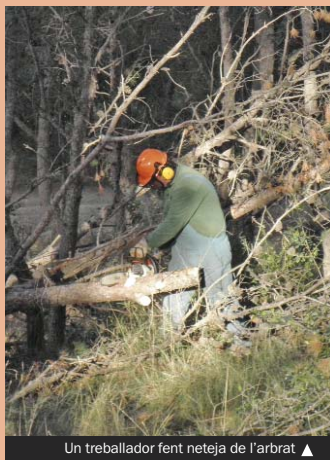
Un treballador fent neteja de l'arbrat ▲

► Es tracta d'un pla d'ocupació emmarcat en el Projecte impuls, que gestiona la Mancomunitat de Municipis de l'Àrea Metropolitana de Barcelona i que ha estat cofinançat pel Fons Social Europeu i pel Servei d'Ocupació de Catalunya. L'objectiu és formar persones, en situació d'atur, en tasques de manteniment a les zones naturals i periurbanes. En aquest sentit, a Santa Coloma es fan feines d'esbrossada herbàcia i arbustiva, triturat de canyes i neteja de rieres, recollida de residus inorgànics i manteniment de la franja de protecció contra incendis.