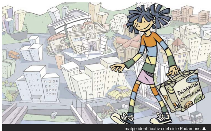
Imatge identificativa del cicle Rodamons ▲

► Este fin de semana se celebran las fiestas de tres barrios. En El Raval destaca la cena, el torneo de fútbol sala, el correfoc y la disco móvil del sábado, y la plantada de capgrossos y las habaneras del domingo. En el barrio Llatí, hay que citar las sevillanas de hoy viernes, las artes marciales y el baile del día 2 y las migas y el homenaje a la tercera edad del día 3. Finalmente, la Asociación de Vecinos de Serra de Marina hace su fiesta el sábado en las pistas de la calle de la Farigola con una cena de alforjas, una demostración de taichi y un baile.