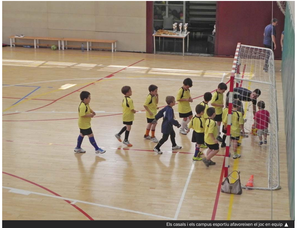
Els casals i els campus esportiu afavoreixen el joc en equip ▶

Els campus esportius són l'altra gran oferta lúdica estiuenc. Enguany, 1.100 nens i nenes tenen l'oportunitat d'aprofitar les vacances d'una manera divertida i saludable: fent esport. Futbol sala, natació, bàsquet, patí i tir amb arc són algunes de les moltes disciplines esportives que hi practiquen. Els campus es porten a terme al llarg del mes de juliol, s'adrecen a la població infantil i han estat organitzats conjuntament per entitats esportives de la nostra ciutat, les empreses concessionàries que gestionen els complexos esportius i l'IME.