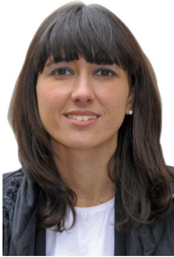
Núria Parlon Gil (PSC) Alcaldeessa de Santa Coloma de Gramenet