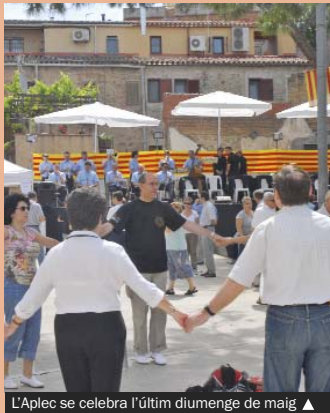
L'Aplec se celebra l'últim diumenge de maig ▲

Actualment, l'Aplec és una festa ciutadana amb valors identitaris, culturals i integradors que convoca sardanistes