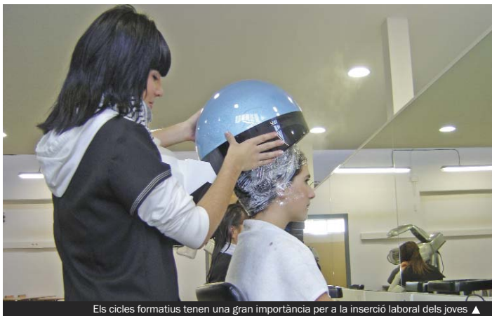
Els cicles formatius tenen una gran importància per a la inserció laboral dels joves ▲

► Esta semana, el Ayuntamiento ha comenzado los trabajos puntuales de reparación del alcantarillado de la calle Mallorca, en el barrio de Can Franquesa. Las obras tienen una duración de dos semanas, aproximadamente, y podrían implicar restricciones de tráfico. Por otra parte, ya se han iniciado los trabajos de reparación de los imbornales de la plaza de l'Avi Porta, en el barrio del Raval, con el objetivo de disminuir las filtraciones de agua en el aparcamiento ubicado en el subsuelo. La intervención durará alrededor de un mes y medio. Por todo ello, el Ayuntamiento solicita disculpas a los vecinos y vecinas por las posibles molestias que estos trabajos les puedan causar y pide que extremen la precaución.