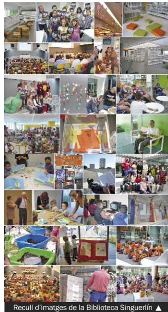
Recull d'imatges de la Biblioteca Singuerlín ▶

La Biblioteca compta amb un fons, especialitzat en cinema d'autor i independent i en cinema documental, amb més de 800 pel·lícules. Qualsevol persona interessada pot fer servir una base de dades que permet buscar les pel·lícules,