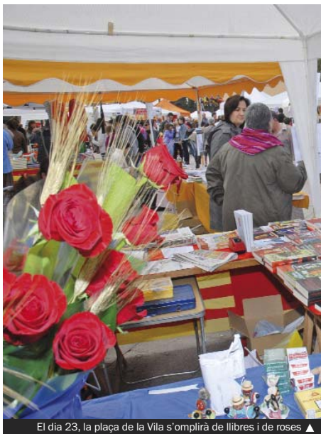
El dia 23, la plaça de la Vila s'omplirà de llibres i de roses ▲