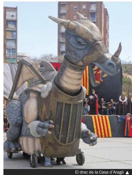
El drac de la Casa d'Aragó ▲