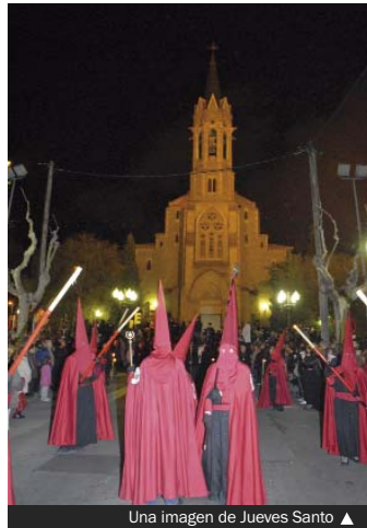
Una imagen de Jueves Santo ▲

El 17 de abril (11.00), la Casa de Aragón también organiza procesión del Domingo de Ramos. El punto de salida será el local de la entidad (calle Sant Josep, 30) para continuar por la calle dels Sagarra, la rambla de Sant Sebastià, la calle de Irlanda y la avenida dels