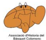
Associació d'Història del Bàsquet Colomenc

Els dies 28 i 30 de març, alumnes de 3r i 4t de primària de l'Escola Ausiàs March van participar al taller "Discapacitat i integració social", inclòs en el Programa d'activitats educatives de l'Ajuntament i organitzat per la Fundació Tallers. Els infants van treballar amb paper reciclat; persones amb discapacitat intel·lectual de la Fundació en feien de formadors. El resultat ha estat valorat com una gran experiència. La Fundació Tallers és una entitat que treballa per a la inserció sociolaboral de les persones amb discapacitat.