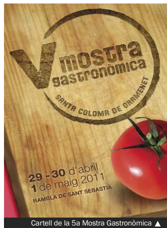
Cartell de la 5a Mostra Gastronòmica ▲

► La 5a edició de la Mostra Gastronòmica se celebrarà els dies 29 i 30 d'abril i 1 de maig, tal com va aprovar la Junta de Govern Local. La Mostra es tornarà a fer a la rambla de Sant Sebastià, a l'illa que hi ha entre els carrers de la Marina, dels Sagarra i de Sant Silvestre. En aquest esdeveniment gastronòmic es podran tastar les propostes més innovadores dels restaurants colomencs participants i gaudir de diverses demostracions culinàries, entre altres activitats. És una oportunitat per comprovar la qualitat, diversitat i innovació de la restauració colomenca, un referent a l'àrea metropolitana. L'organització és obra de l'Associació Colomenca d'Oci i Restauració, que compta amb el suport de l'Ajuntament, amb la participació de l'Escola de Restauració i amb la col·laboració de l'ACI i de Fondo Comerç.