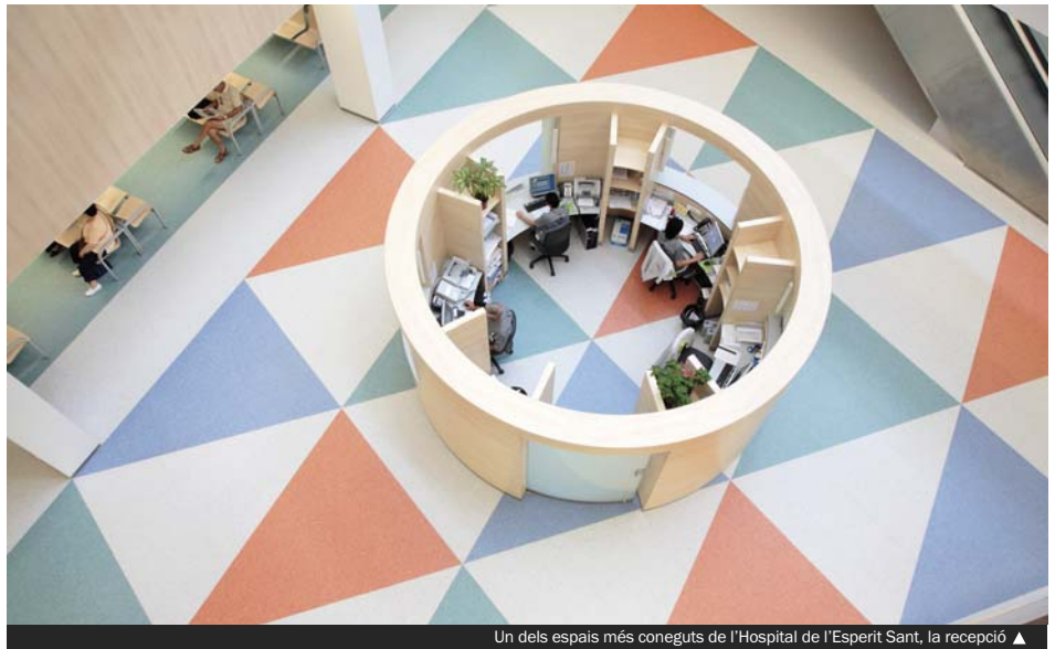
Un dels espais més coneguts de l'Hospital de l'Esperit Sant, la recepció ▲

Tant l'Ajuntament com la FHES expressen, amb aquest conveni, la voluntat de consolidar l'Hospital de l'Esperit Sant com a centre de referència per a la població de Santa Coloma de Gramenet i del seu entorn. Ambdues institucions treballen per aconseguir la fidelització de les persones usuàries i per reforçar els valors de proximitat, compromís i transparència.