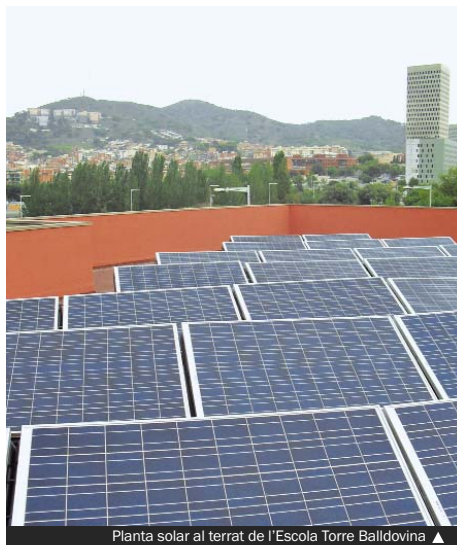
Planta solar al terrat de l'Escola Torre Balldovina ▲

El Programa d'energies renovables de Santa Coloma de Gramenet disposa ja de sis instal·lacions fotovoltaïques en funcionament: l'Institut Ramon Berenguer IV (5 kWp de potència), l'Escola Ferran de Sagarra (17,45 kWp), la Biblioteca Central (10 kWp), el Polígon del Bosc Llarg (9 kWp), el Cementiri (100 kWp) i l'Escola Torre Balldovina (23,3 kWp). En conjunt, la ciutat disposa de 1.260 m 2 de panells solars fotovoltaïcs i de 2.500 m 2 de panells solars tèrmics en funcionament, la qual cosa suposa un estalvi total anual de 1.000.000 de kWh —l'equivalent a l'electricitat consumida per 145 famílies— i un estalvi anual d'emissions de 470 tones de diòxid de carboni.