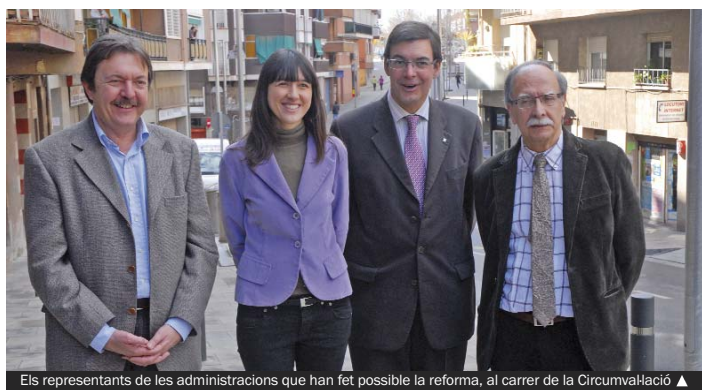
Els representants de les administracions que han fet possible la reforma, al carrer de la Circumval·lació ▲

L'endemà, dia 6, serà el torn dels més petits. Hi haurà una gran festa (plaça de la Vila, 12.00) que animarà la companyia Encara Farem Salat.