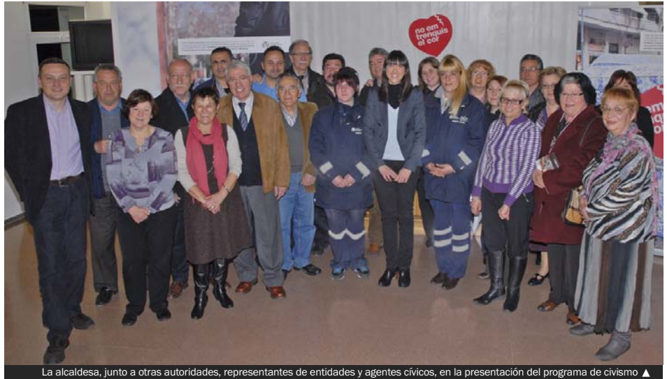
La alcaldesa, junto a otras autoridades, representantes de entidades y agentes cívicos, en la presentación del programa de civismo ▲