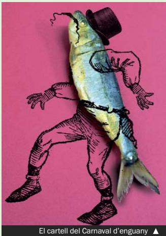
El cartel·l del Carnaval d'enguany ▲

Les 24 comparses que hi participen són aquestes: Escuela de Danza Yolanda Valero, Farándula, Wakacalvet, Quins Pebrots, Los sandwiches del Buenoque!, Barcino, Club Petanca Can Mariner, Los elfos del bosque, Los pretorianos de Riu Nord, El bosque, Trabajadoras familiares, Davant la crisi, un somriure!, El circ,