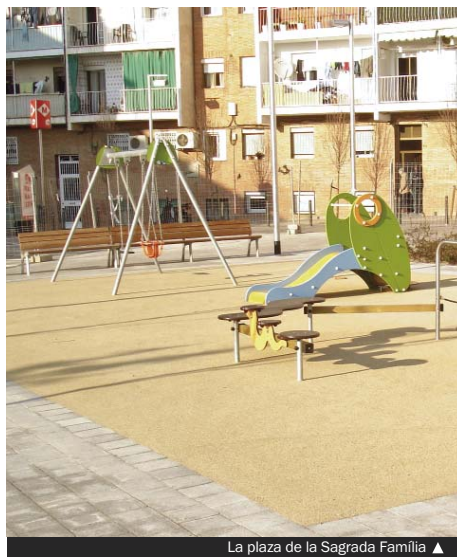
La plaza de la Sagrada Família ▲

En conjunto, las obras se han realizado aprovechando la urbanización de los exteriores de la parada de metro Singuerlín de la L9 y han sido financiadas por la Generalitat (GISA), por encargo de la Direcció General d'In-