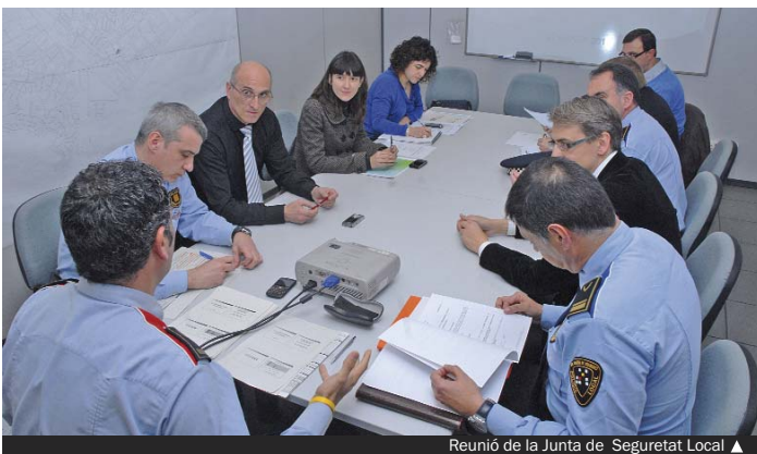
Reunió de la Junta de Seguretat Local ▲

la contratación de unas 300 personas. El 70% de la inversión se ha dedicado a proyectos del ámbito de la educación y la infancia. Además de las dos llars d'infants mencionadas, que se pondrán en marcha en abril, con el fondo estatal se han hecho obras de mejora en 17 centros escolares, se han puesto en marcha diferentes programas educativos y se han reforzado los programas de atención social. También se han mejorado varios equipamientos y la accesibilidad en diversos puntos de la ciudad.