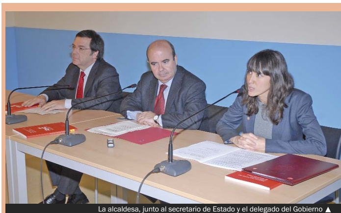
La alcaldessa, junto al secretario de Estado y el delegado del Gobierno ▲