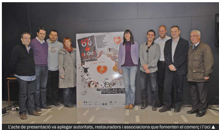
L'acte de presentació va aplegar autoritats, restauradors i associacions que fomenten el comerç i l'oci ▲

Cèntric Formació ha obert el termini d'informació i preinscripció dels cursos de formació professional per a l'ocupació de disseny gràfic informatitzat (nivell 1) i d'anglès (nivell 1). Subvencionats pel Consorci per a la Formació Contínua de Catalunya i el Fons Social Europeu, aquests cursos s'adrecen a treballadors autònoms de qualsevol sector. Més informació, a l'avinguda de la Generalitat, 5 (tel. 93 385 64 11).