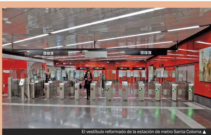
El vestíbul reformado de la estació de metro Santa Coloma ▲