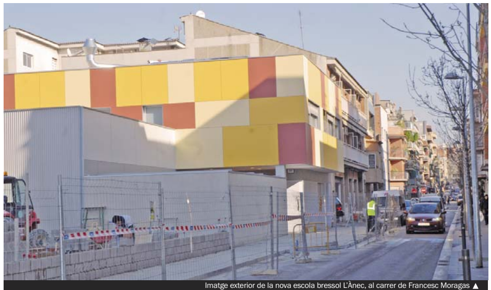
Imatge exterior de la nova escola bressol L'Ànec, al carrer de Francesc Moragas ▲