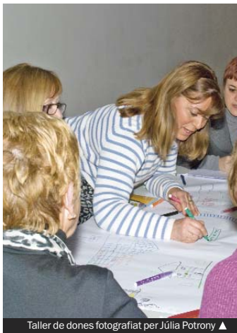
Taller de dones ▲

Entre el 17 i el 21 de gener s'han celebrat cinc tallers de debat precongessuals, on s'han tractat diverses temàtiques: des de les noves masculinitats (Sant Adrià de Besòs) a les malalties que no deixen viure (Tiana), passant per la reflexió sobre els usos del temps