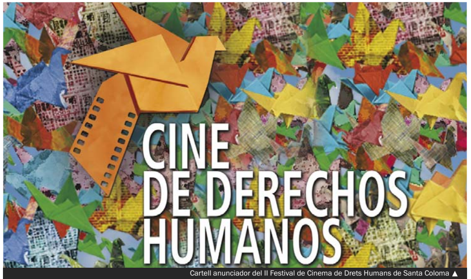
Cartell anunciador del II Festival de Cinema de Drets Humans de Santa Coloma ▲