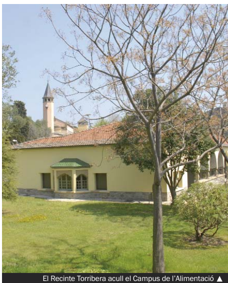
El Recinte Torribera acull el Campus de l'Alimentació ▲

En paral·lel a aquestes activitats, hi haurà una zona firal amb estands d'entitats dedicades a l'alimentació —empreses, mercats municipals de Santa Coloma i Agència de Seguretat Alimentària, entre altres— amb informació nutricional i tast de productes. El públic podrà visitar l'exposició "Història de l'Alimentació en el Segle XX a Espanya", organitzada per la Fundació Triptolemos.