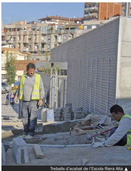
Treballs d'acabat de l'Escola Riera Alta ▲

Pel que fa a l'estructura d'aquest equipament, s'ha op-