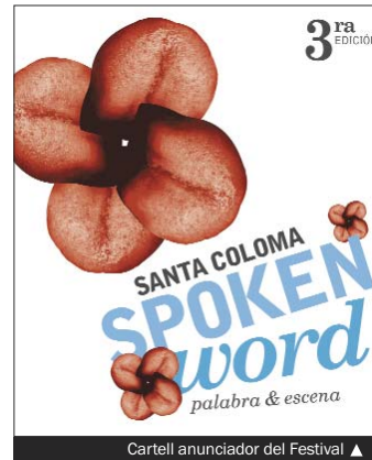
Cartell anunciador del Festival ▲

També s'han posat a la venda les entrades per al concert del cantaor flamenc José Mercé del dia 30 (Tel-entrada 902 10 12 12 i www.telentrada.com ).