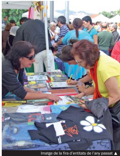
Imatge de la fira d'entitats de l'any passat ▶

La tarda de dissabte estarà íntegrament dedicada al cinema solidari. L'Auditori Can Roig i Torres acollirà, en primer lloc (18.00), la projecció d' Invictus . Com se sap, es tracta de l'última pel·lícula del gran Clean Easwood. Basada en el llibre El factor humano , de John Carlin, i amb Morgan Freeman i Matt Damon en els papers protagonistes, narra una història ambientada en Sud-àfrica poc després que Nelson Mandela sortís