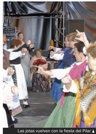
Las jotas vuelven con la fiesta del Pilar ▲

Divendres 8 Wagner, 7 / Rbla. de Sant Sebastià, 24 Dissabte 9 Mn. Camil Rosell, 40 / Sant Joaquin, 44-46 Diumenge 10 Av. de la Generalitat, 76 / Pl. de la Vila, 3 Dilluns 11 Juli Garreta, 14 / Beethoven, 25 Dimarts 12 Milà i Fontanals, 79 / Cultura, 39 Dimecres 13 Av. de la Generalitat, 226 / Av. de Catalunya, 33 Dijous 14 Mn. J. Verdaguier, 107 / Major, 46 Aquestes quatre farmàcies obren cada dia de 9 a 22 hores: rambla de Sant Sebastià, 24; Milà i Fontanals, 27; Valentí Escalans, 7; i passatge d'en Caralt, 22.