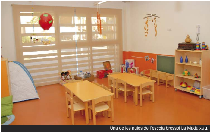
Una de les aules de l'escola bressol La Maduixa ▲