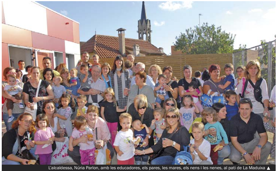
L'alcaldesa, Núria Parlon, amb les educadores, els pares, les mares, els nens i les nenes, al pati de La Maduixa ▲

La posada en marxa de noves llars d'infants és una prioritat per a l'equip de govern municipal. L'objectiu final és pal·liar l'actual dèficit de places d'aquest segment de l'educació infantil. En aquest sentit, ja són quatre les escoles bressol públiques que fan classes amb total normalitat: La Maduixa, Els Pins (c. Pirineus, 4), l'Esquirol (ptge. d'en Salvatella, s/n) i La Ciçonya (c. Sant Joaquim, 70).