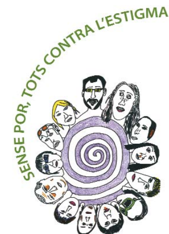
Logotipo del Día de la Salud Mental ▲

Las actividades del Día Mundial de la Salud Mental comenzarán el 6 de octubre (18.00) en la Biblioteca Singsuerlín-Savador Cabré, con la charla coloquio "Rehabilitación psicosocial e inserción laboral en las personas afectadas por