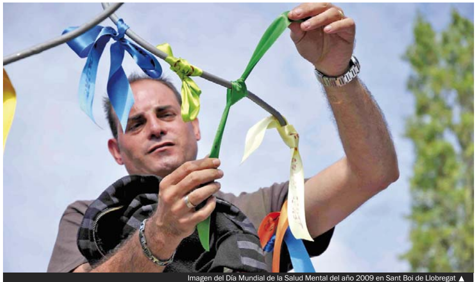
Imagen del Día Mundial de la Salud Mental del año 2009 en Sant Boi de Llobregat ▶