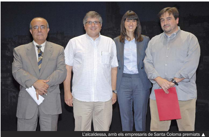
L'alcaldeessa, amb els empresaris de Santa Coloma premiats ▲

A més del premi esmentat, es van atorgar altres guardons, entre els quals destaquem el reconeixement a l'empresa municipal Grameimpuls, com a ens local presentador d'una empresa premiada i com a proveïdor de serveis a empreses. En el decurs de l'acte, l'alcaldeessa va destacar el treball de la Diputació en col·laboració amb els ens locals en el foment de l'emprenedoria, sobretot en aquests moments de crisi econòmica.