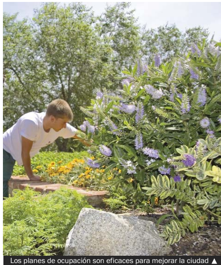
Los planes de ocupación son eficaces para mejorar la ciudad ▶

Las personas contratadas participarán en 12 proyectos de mejora de la ciudad