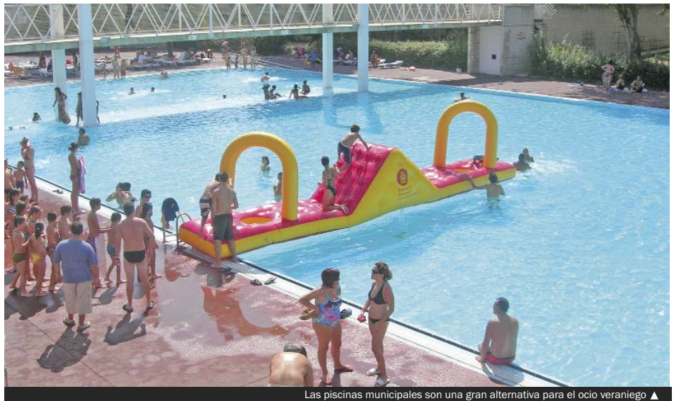
Las piscinas municipales son una gran alternativa para el ocio veraniego ▲

Por su parte, el Complex Esportiu de Torribera abre todos los días de 11.00 a 19.00. La temporada también comenzará aquí el día 25 y se prolongará hasta el 29 de agosto. Las entradas de los días laborables costarán 3,70 € para los adultos y 2,80 € para los menores de 14 años, jubilados y discapacitados. Los sábados, domingos y festivos tendrán que pagar, respectivamente, 4,20 € y 3,35 €. El abono de adultos es de 15 entradas, de lunes a sábado, y vale 39,90 €. El mismo abono para el otro grupo, de lunes a sábado, cuesta 30,70 €.