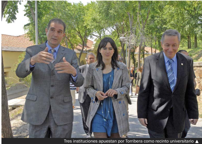
Tres instituciones apuestan por Torribera como recinto universitario ▲

En palabras de la alcaldesa, Núria Parlon, "el Campus de l'Alimentació en Torribera responde a un proyecto estratégico de ciudad, en clave metropolitana, que supondrá una contribución importante a la dinamización de Santa Coloma". Por su parte, el presidente de la Diputación de Barcelona, Antoni Fogu, destacó que "en un contexto en el que la crisis es omnipresente hay iniciativas y