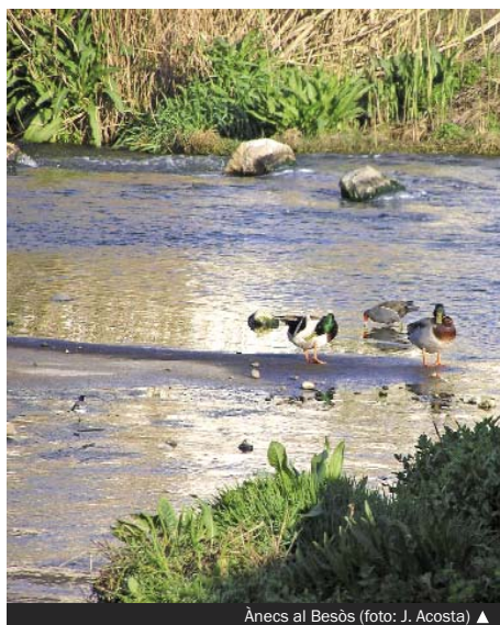
Ànecs al Besòs ▲

A Santa Coloma hi ha dos grans espais naturals on es treballa a fons per tenir cura i mantenir els seus ecosistemes. Al parc fluvial del Besòs, els ocells són el grup de vertebrats més ben representats i el seu estudi continuat