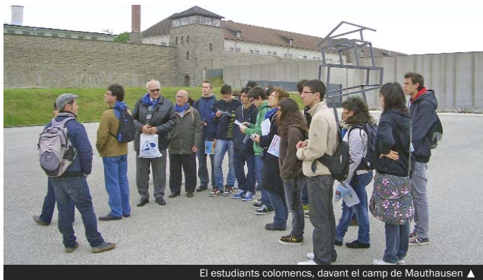
El estudiants colomencs, davant el camp de Mauthausen ▲

D'altra banda, el grup d'alumnes de l'institut Numància ha guanyat en-