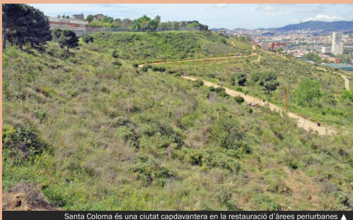
Santa Coloma és una ciutat capdavantera en la restauració d'àrees periurbanes ▲

Des del seu començament, la prioritat és la recuperació de les superfícies de muntanya més properes a la zona urbana a través de la participació de persones en procés d'inserció sociolaboral, que procedeixen d'escoles taller o bé dels plans d'ocupació.