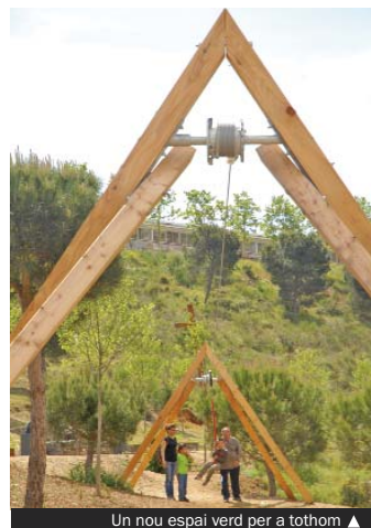
Un nou espai verd per a tothom ▲

Amb la reforestació de la Bastida, s'han creat nous espais verds d'oci. Per poder assolir la transformació d'aquesta zona, s'ha partit del respecte als seus valors ecològics i s'ha comptat en tot moment amb les opinions de les entitats que hi han fet plantacions al llarg dels darrers anys.