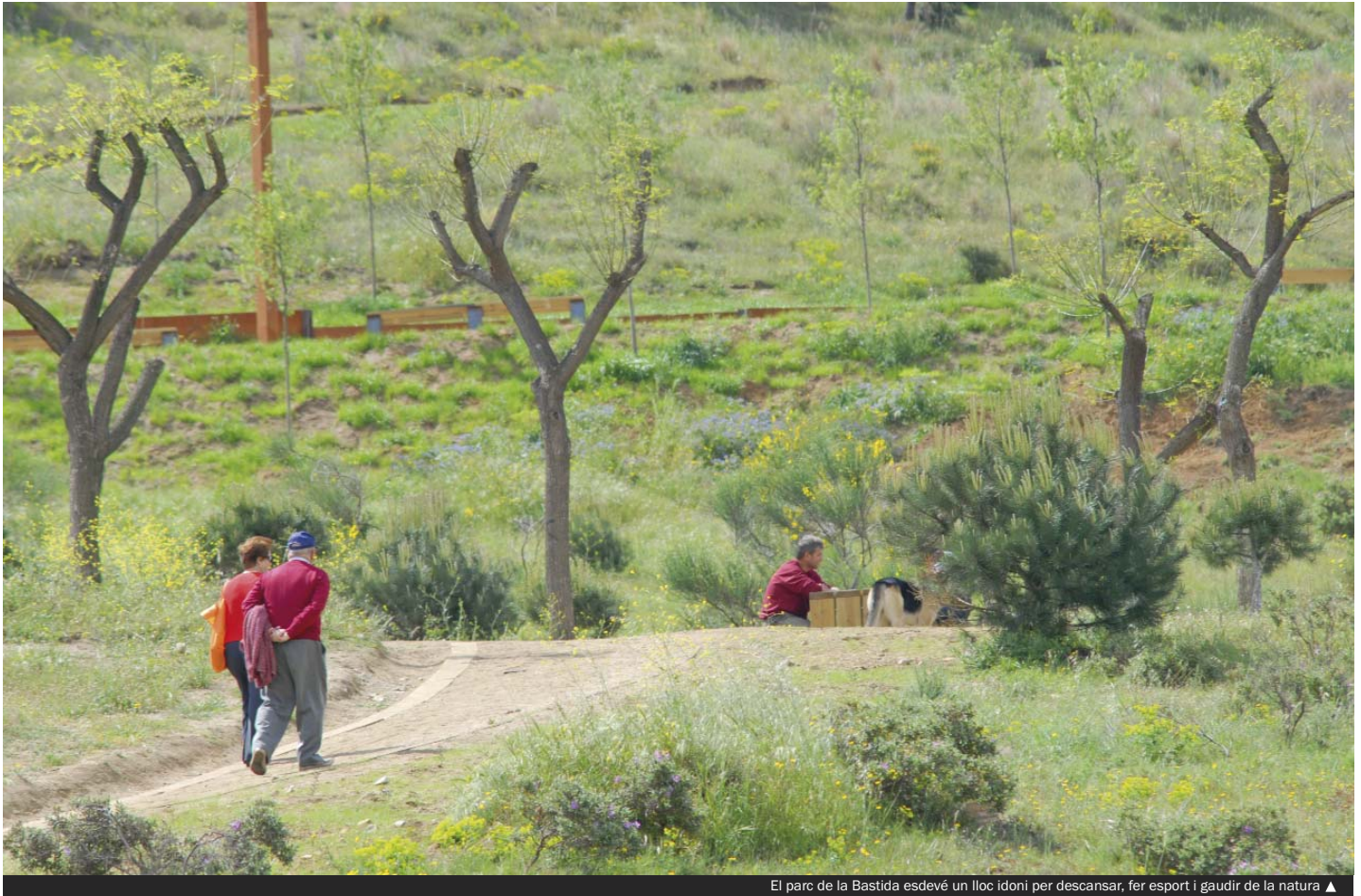
El parc de la Bastida esdevé un lloc idoni per descansar, fer esport i gaudir de la natura ▲