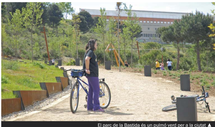
El parc de la Bastida és un pulmó verd per a la ciutat ▲

Des de l'any 2000, diversos centres educatius —l'institut Numància i les escoles Les Palmeres, Pallaresa i Verge de les Neus— i algunes entitats han fet plantacions en aquesta zona, de la mateixa manera que els participants en diversos cursos de formació ocupacional s'han dedicat a fer treballs de reforestació i manteniment.