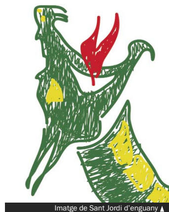
Imatge de Sant Jordi d'enguany ▲

D'altra banda, la Casa d'Aragó farà un mercat medieval els dies 24 i 25 d'abril