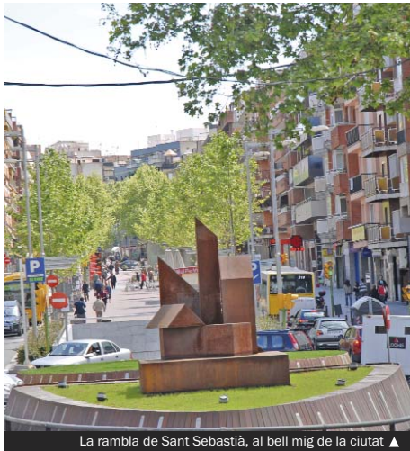
La rambla de Sant Sebastià, al bell mig de la ciutat ▶

En la primera fase del procés, l'equip de govern local i la UOC definiran les bases d'acció de l'esmentat pla. El procés serà participatiu i científic, es preveu que durarà uns quatre mesos i estarà dirigit per l'alcaldesa i pels prestigiosos especialistes i professors de la UOC, Jordi Borja (geògraf i urbanista) i Manuel Herce (enginyer). Aquesta etapa de treball i reflexió es basarà en la captació d'opinions i reflexions mitjançant entrevistes i debats. L'objectiu és que aquest mateix any es tingui el full de ruta que marcarà tot el procés de desenvolupament del nou model de ciutat dels propers anys.