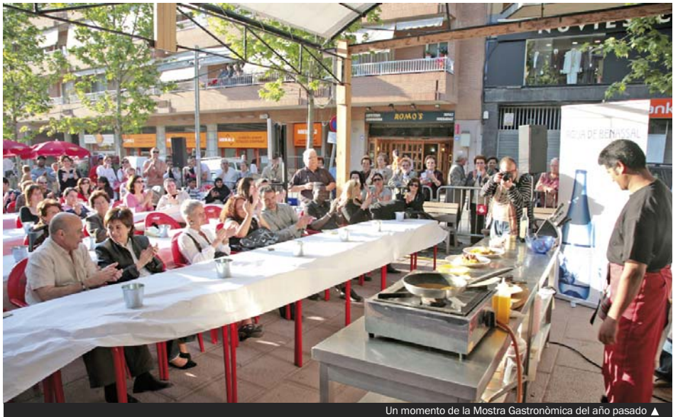
Un momento de la Mostra Gastronòmica del año pasado ▲

La Mostra Gastronòmica está organizada por el Ayuntamiento, a través de la empresa municipal Grameimpuls, la Associació Colomenca d'Oci i Restauració (ACOR) y la Agrupació del Comerç i la Indústria (ACI) con la colaboración de los mercados municipales. En su cuarta edición, la feria se consolida como uno de los acontecimientos gastronómicos destacados de Cataluña en cuanto a número de visitantes y calidad de las catas y demostraciones. Este año se espera que asistan unas 50.000 personas, aproximadamente.