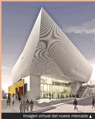
Imagen virtual del nuevo mercado ▲

El nuevo edificio será un poliequipoamiento que dispondrá del mercado municipal propiamente dicho, un supermercado, una guardería y una biblioteca. Tendrá una superficie total de 8.954,26 m 2 , y este proyecto implicará la remodelación urbanística de la zona y el nacimiento de una nueva centralidad para Santa Coloma.