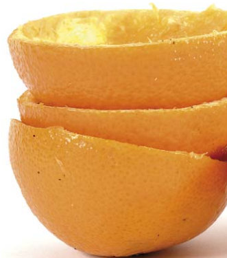
Recogida selectiva también en lo orgánico ▲

La recogida segregada de materia orgánica ayuda a disminuir el volumen de los residuos municipales que deben recibir un tratamiento finalista (incineración o deposición controlada). Esto ya es un beneficio porque la materia orgánica puede ser muy contaminante.