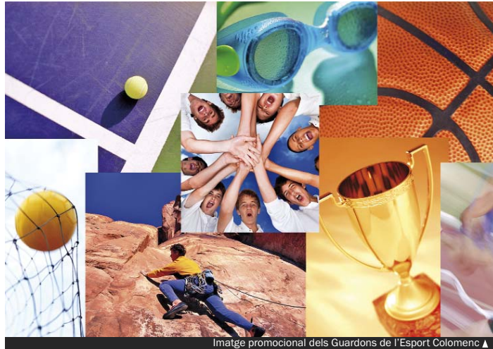
Imatge promocional dels Guardons de l'Esport Colomenc ▲

D'altra banda, cal remarcar l'ascens i la progressió de l'esport femení colomenc, així com l'esport de base —el percentatge d'èxits en categories inferiors és