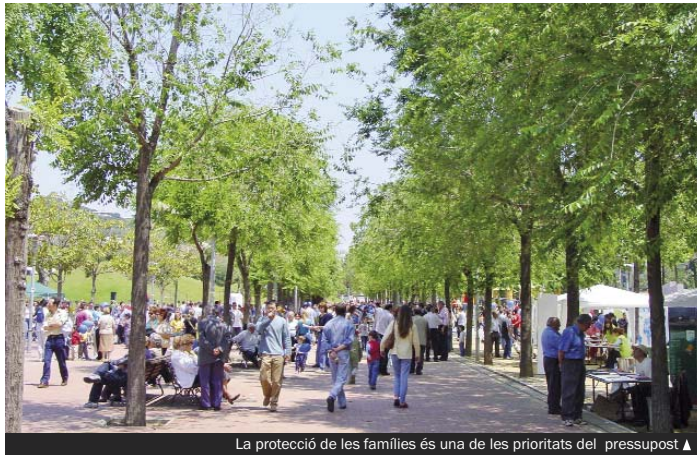
La protecció de les famílies és una de les prioritats del pressupost ▲

En la actualidad, los agentes cívicos del Ayuntamiento realizan el seguimiento y el control del cartón comercial; advierten a las personas afectadas sobre las acciones incívicas que se han de evitar (no recoger los excrementos de los animales de compañía, escupir en la vía pública, lanzar chicles o no hacer un buen uso de los contenedores de separación de residuos, etc.), y controlan los residuos orgánicos que generan diferentes establecimientos de la ciudad, entre otras tareas.