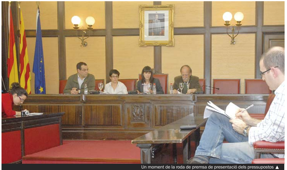
Un moment de la roda de premsa de presentació dels pressupostos ▲